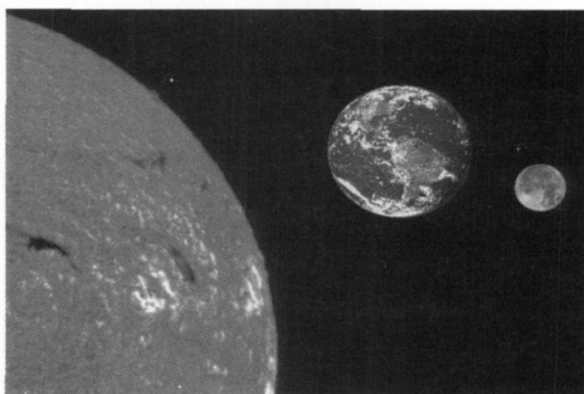
图1 太阳-地球-月亮,我们的家园.造物神奇,将太阳这个热源放在一个允许生命出现的距离上

太阳对于地球上的活动,包括其上人类的出现和人类中物理学家的出现,是具有决定性的影响的,因此容易理解太阳在人类文明中的关键地位.考察人类的文明史会注意到,许多地域的早期文明都存在太阳崇拜;倘若是信奉一神教的话,这唯一的神可能就是太阳.太阳每天从东方升起,影响着地球的每一个角落.自然地,人们关于自然的思考会时常掠过太阳;循着因果的链条,地球上许多自然现象都可能